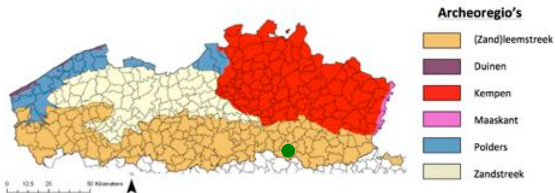
Fig. 1.1: Situering van het projectgebied binnen de verschillende Vlaamse archeoregio's 1 .