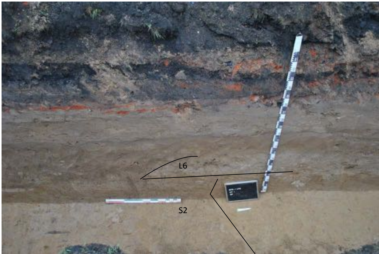
Fig. 3.4: Profiel met verbreding en ophoging van het wegtracé ter hoogte van S2.

Het jongste wegtracé vertoont geen greppels meer. De ophoging (lagen L4, L7 en L9) gebeurde voornamelijk met leem en het lijkt er op dat het profiel van de weg eerder bol moet geweest zijn. Mogelijk is dit tracé middeleeuws of zelf post middeleeuws te dateren gezien er in laag 9 een klein fragment steengoed werd aangetroffen. De breedte van de weg bleef ongeveer gelijk met 11,9 m.