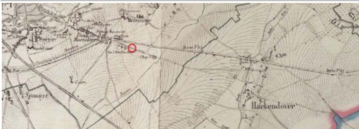
Fig. 1.7: Uittreksel uit de kaart van Vandermaele met situering van het projectgebied.