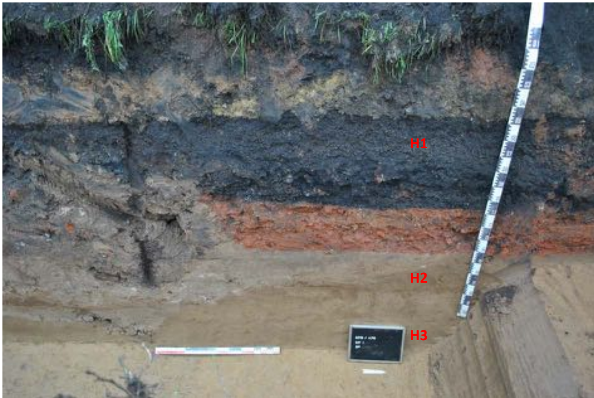
Fig. 3.2: Deelsequentie van het lengteprofiel met een zicht op de ophogingspakketten en verstoringen.