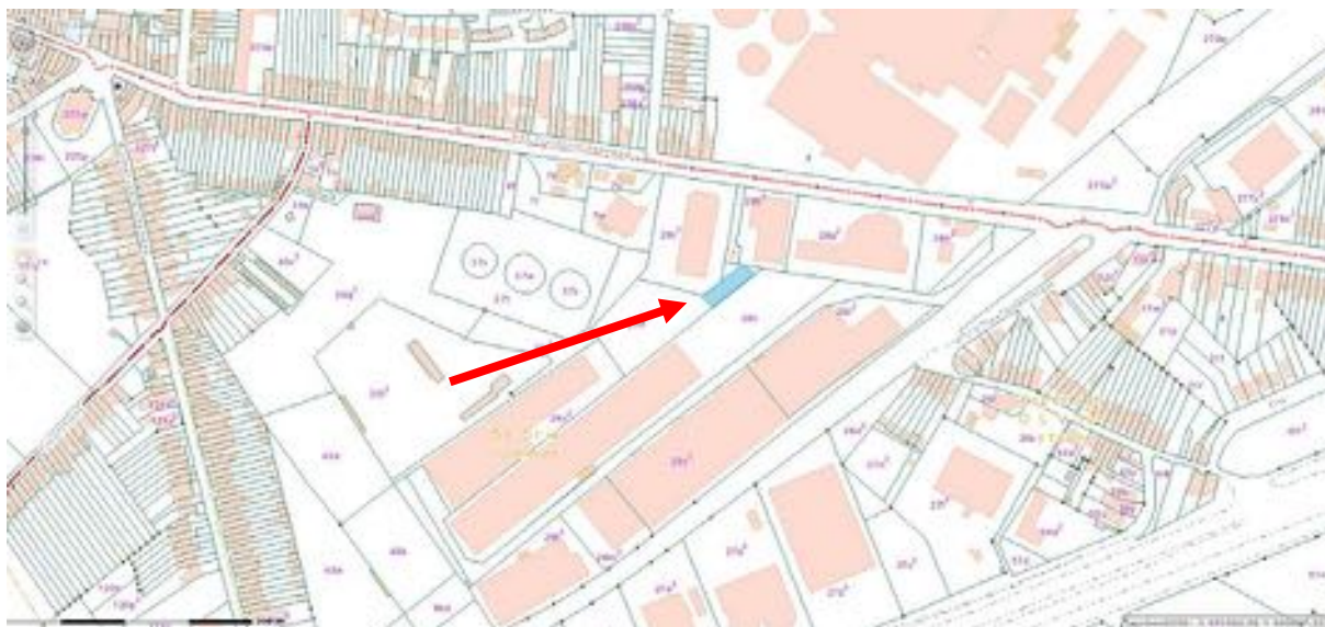
Fig. 1.1: Kadasterkaart met aanduiding van het projectgebied

Het projectgebied beslaat ca. 1235 m 2 en ligt tussen de Sint-Truidensesteenweg in het noorden en het zuidoosten en de Wulmersumsesteenweg in het westen (fig. 1.1). Binnen dit gebied moest enkel de infiltratiegracht (45 x 1,6 m) opgegraven worden. Geo-archeologisch gezien is het onderzoeksgebied gesitueerd in de (zand)leemstreek.