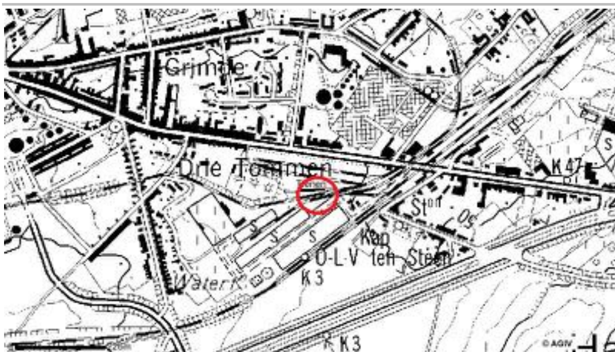
Fig. 1.2: Topografische kaart met aanduiding van het projectgebied.