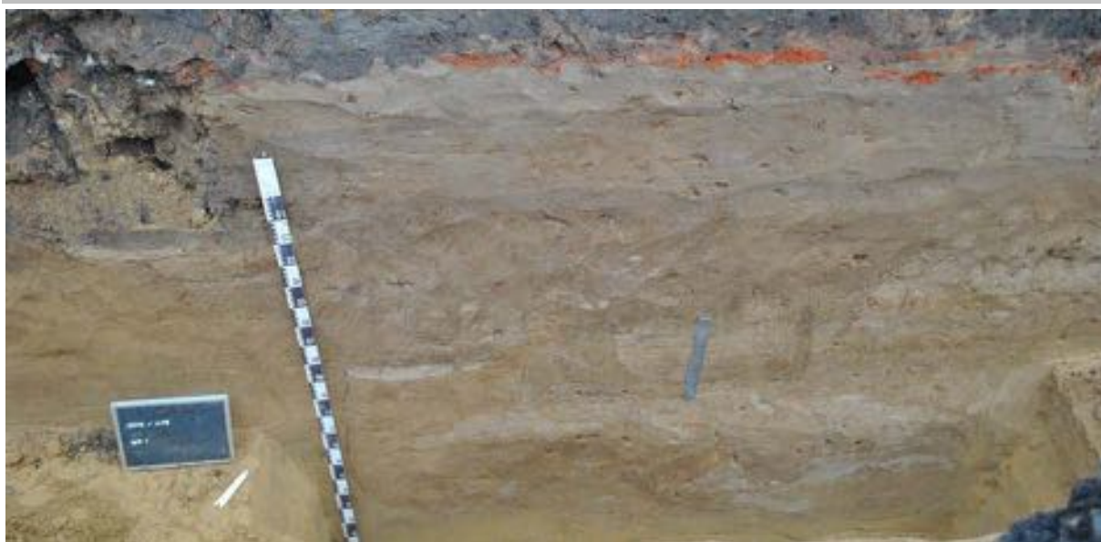
Fig. 3.3: Het profiel van S2.

Op een bepaald moment is het wegtracé verbreed en verhoogd met ongeveer 40 cm zand en kiezel (lagen L1, L5 en L6). Hierbij werden de noordelijke greppels opgevuld waardoor de weg langs de noordzijde bijna 3 m breder werd. De zuidelijke greppel (S2) is vervangen door twee ondiepe greppels (L10). Hierbij is het wegtracé ook langs de zuidzijde 2 m breder geworden waarbij laag L6 over S2 kwam te liggen (fig. 3.4). De noordkant van het wegtracé ligt ongeveer 50 cm hoger dan de zuidkant. De totale breedte van de weg (greppels inbegrepen) lag nu op 13,10 m, maar doordat langs 1 kant er geen greppel meer aanwezig was en de greppel langs de andere zijde veel smaller werd, werd het eigelijke loopoppervlak met 11,15 m ongeveer 5,35 m breder.