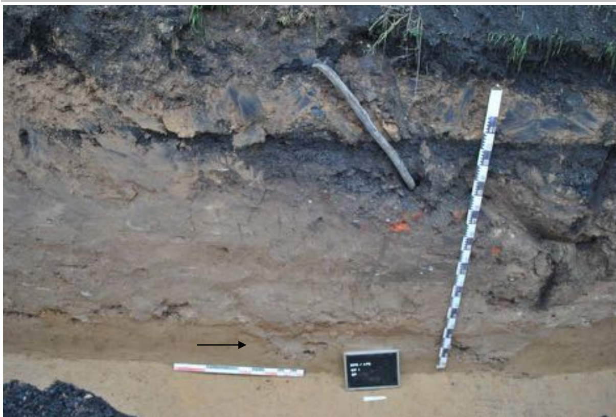
Fig. 3.2: Het profiel ter hoogte van de noordelijke greppels.

Langs de zuidkant van de weg bleek bij het opkuisen nog een groot spoor, S2, in het vlak zichtbaar te zijn. In profiel had dit spoor een U-vormig profiel met een breedte van ongeveer 2,5 m. Door de te beperkte ruimte kon niet uitgemaakt worden of het om een greppel ging, maar de begrenzing in het vlak leek wel dezelfde oriëntatie te volgen als het wegtracé. Gezien de weg naar het zuiden afhelt en dit spoor (S2), naast het wegtracé ligt, is het met de huidige gegevens de meest aannemelijke verklaring dat dit ook een afwateringsgreppel was (fig. 3.3). In laag 5 van S2 werd een stukje baksteen aangetroffen. Het is te fragmentair om de vorm na te gaan, maar door de stratigrafische positie van het spoor wordt er van uit gegaan dat het een Romeinse datering heeft.