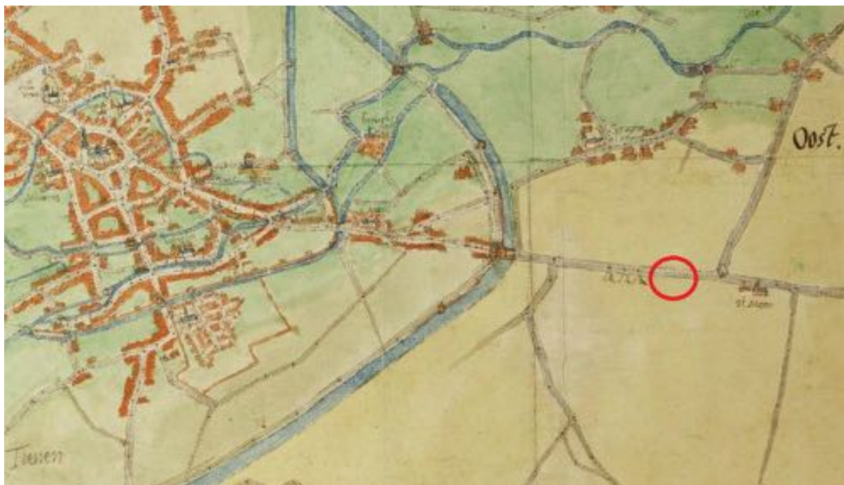
Fig. 1.5: Uittreksel uit de Atlas des villes des Pays-Bas met situering van het projectgebied.