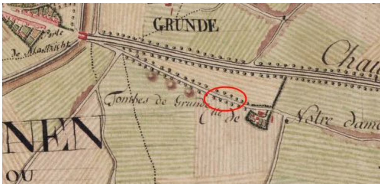
Fig. 1.6: Uittreksel uit de Ferrariskaart met situering van het projectgebied.