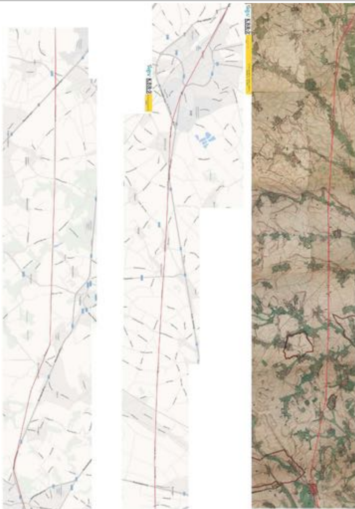
Fig. 3.5: Overzicht van het Romeinse wegtracé op de ferrariskaart en het huidige wegennet.