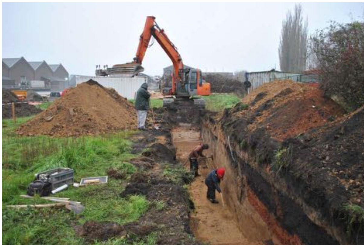
Fig. 2.1: De aanleg van de sleuf.

Gezien de beperkte oppervlakte van de uit te graven zone (infiltratiegracht) werd, in samenspraak met Tom Debruyne van Portiva, besloten om de sleuf dadelijk tot in de natuurlijke bodem uit te graven (fig. 2.1). Het westprofiel van de sleuf werd volledig manueel opgekuist, gefotografeerd en digitaal ingetekend op schaal 1/1. Het vlak, de sleufwand en de meetpinnen in het profiel werden gegeoreferencieerd ingemeten met behulp van GPS.